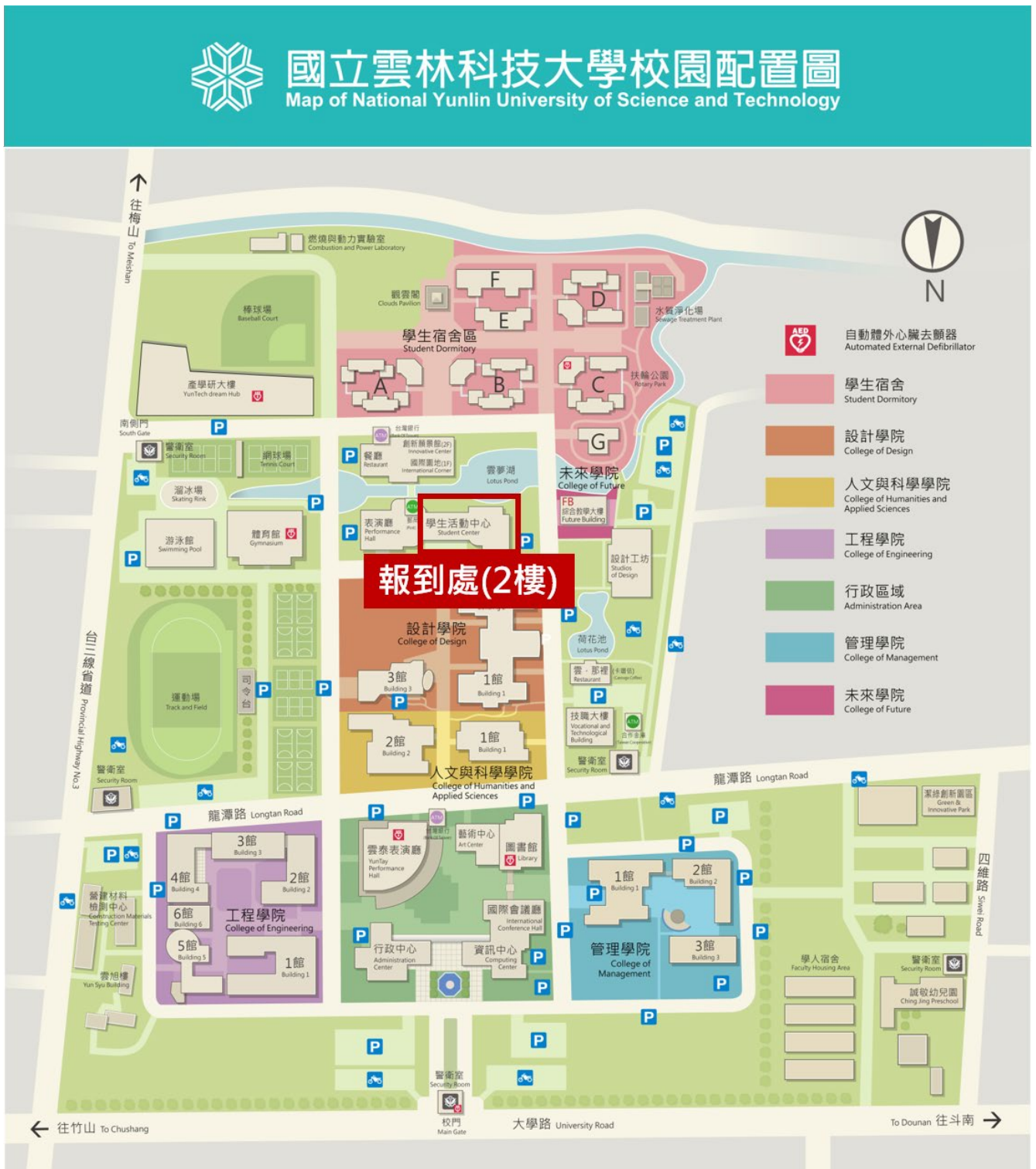
〔圖1〕報到地點路線圖

請參賽隊伍備妥 學生證 於12月6日(星期六)上午9時至9時30分一同完成報到，報到地點於本校活動中心2樓(圖1)。